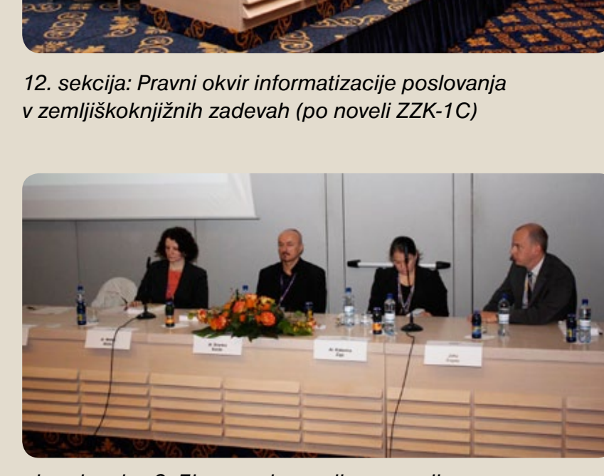
ministri na dnevih slovenskih pravnikov