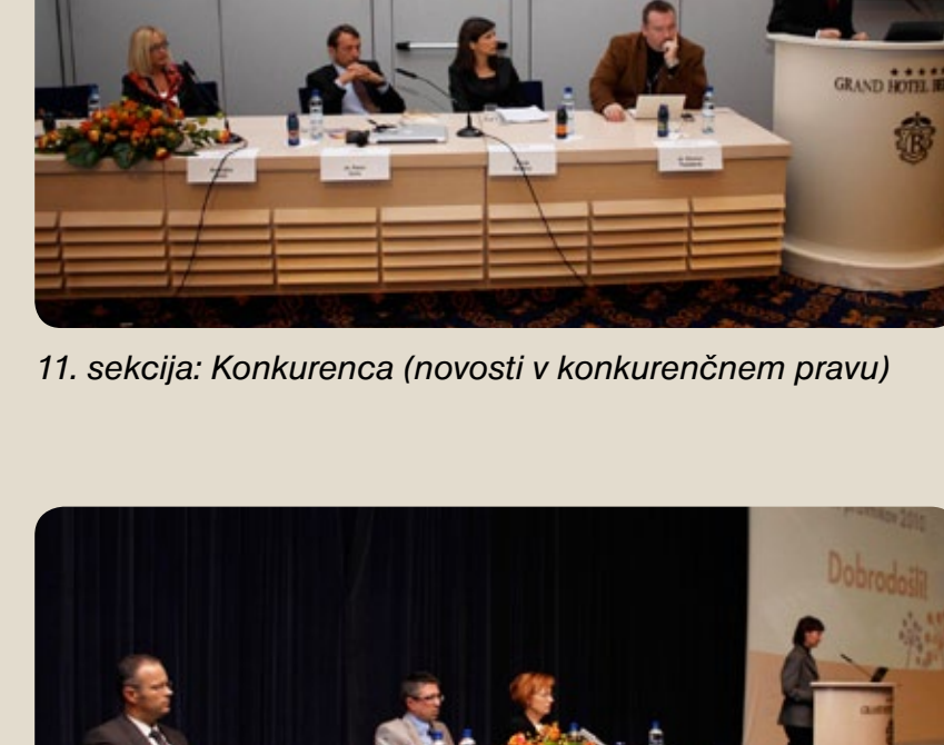
udeleženci na predavanju